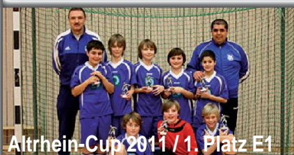
Altrhein-Cup 2011 / 1. Platz E1