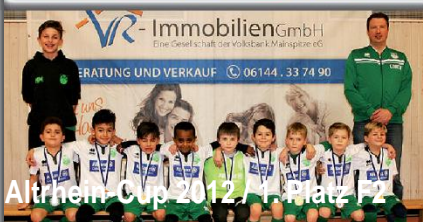
Altrhein-Cup 2012 / 1. Platz F2