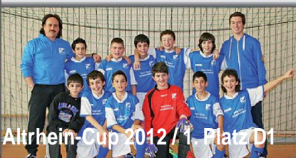
Altrhein-Cup 2012 / 1. Platz D1