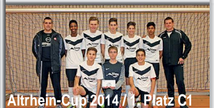
Altrhein-Cup 2014 / 1. Platz C1