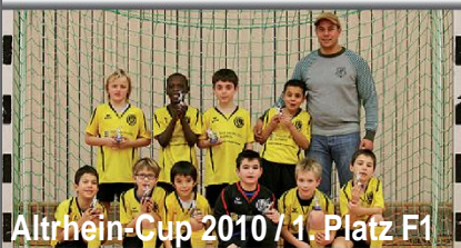
Altrhein-Cup 2010 / 1. Platz F1