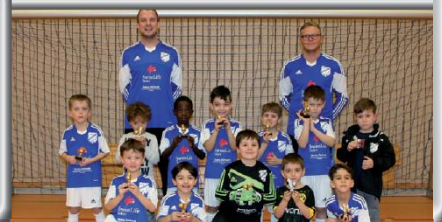
Altrhein-Cup 2012 / 1. Platz D1