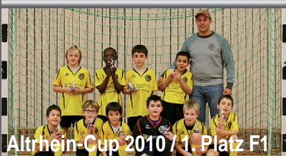
Altrhein-Cup 2010 / 1. Platz F1