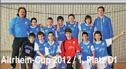
Altrhein-Cup 2012 / 1. Platz D1