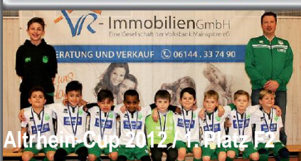
Altrhein-Cup 2012 / 1. Platz F2