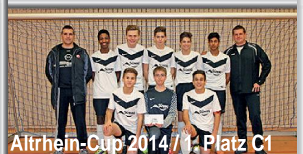
Altrhein-Cup 2014 / 1. Platz C1