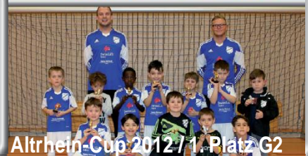
Altrhein-Cup 2012 / 1. Platz G2