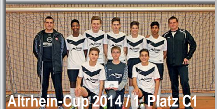
Altrhein-Cup 2014 / 1. Platz C1