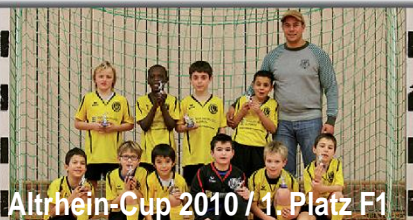
Altrhein-Cup 2010 / 1. Platz F1