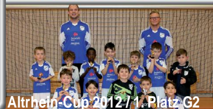
Altrhein-Cup 2012 / 1. Platz G2