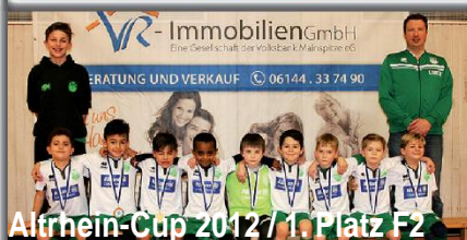
Altrhein-Cup 2012 / 1. Platz F2