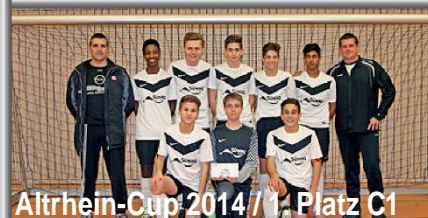
Altrhein-Cup 2014 / 1. Platz C1