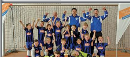
Altrhein-Cup 2017 / 1. Platz G1