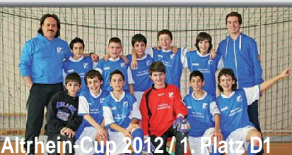
Altrhein-Cup 2012 / 1. Platz D1