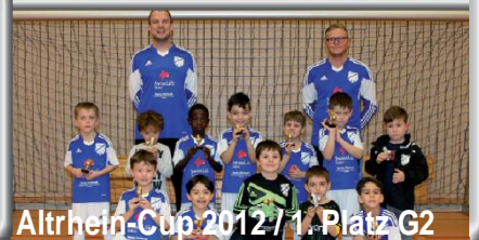
Altrhein-Cup 2012 / 1. Platz G2