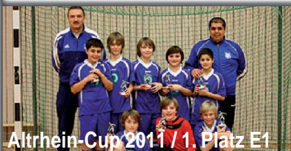
Altrhein-Cup 2011 / 1. Platz E1