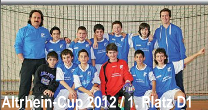
Altrhein-Cup 2012 / 1. Platz D1