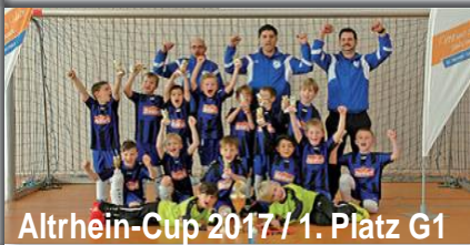
Altrhein-Cup 2017 / 1. Platz G1