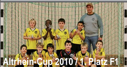
Altrhein-Cup 2010 / 1. Platz F1