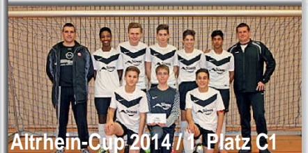
Altrhein-Cup 2014 / 1. Platz C1