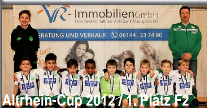
Altrhein-Cup 2012 / 1. Platz F2