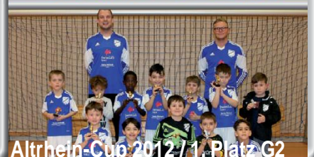
Altrhein-Cup 2012 / 1. Platz G2