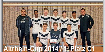
Altrhein-Cup 2014 / 1. Platz C1