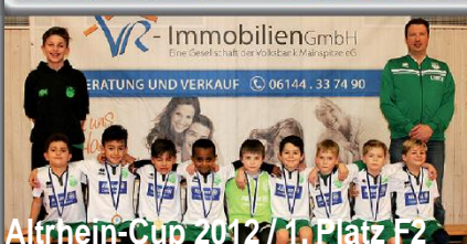
Altrhein-Cup 2012 / 1. Platz F2