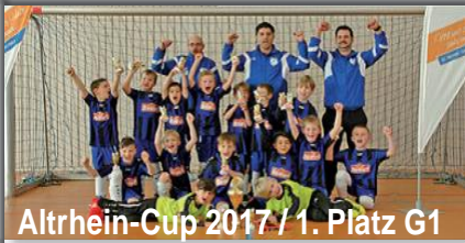
Altrhein-Cup 2017 / 1. Platz G1