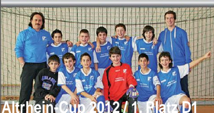
Altrhein-Cup 2012 / 1. Platz D1