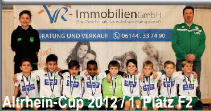
Altrhein-Cup 2012 / 1. Platz F2