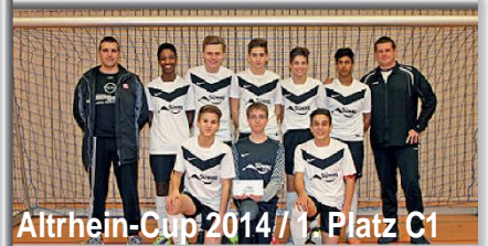
Altrhein-Cup 2014 / 1. Platz C1