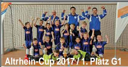
Altrhein-Cup 2017 / 1. Platz G1