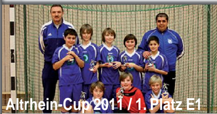
Altrhein-Cup 2011 / 1. Platz E1