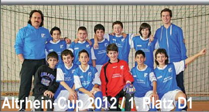
Altrhein-Cup 2012 / 1. Platz D1