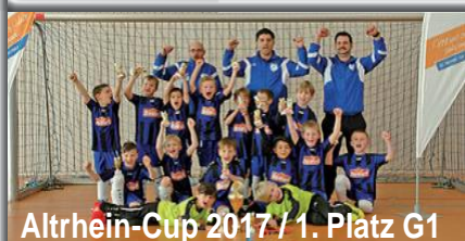
Altrhein-Cup 2017 / 1. Platz G1