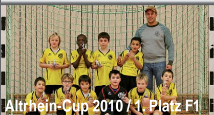
Altrhein-Cup 2010 / 1. Platz F1