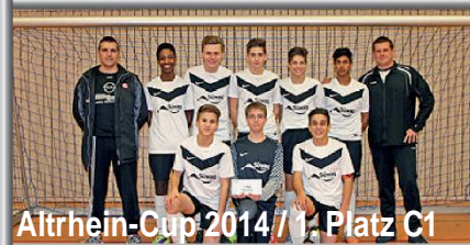
Altrhein-Cup 2014 / 1. Platz C1