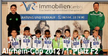
Altrhein-Cup 2012 / 1. Platz F2