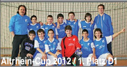
Altrhein-Cup 2012 / 1. Platz D1