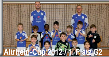
Altrhein-Cup 2012 / 1. Platz G2