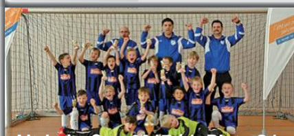
Altrhein-Cup 2017 / 1. Platz G1